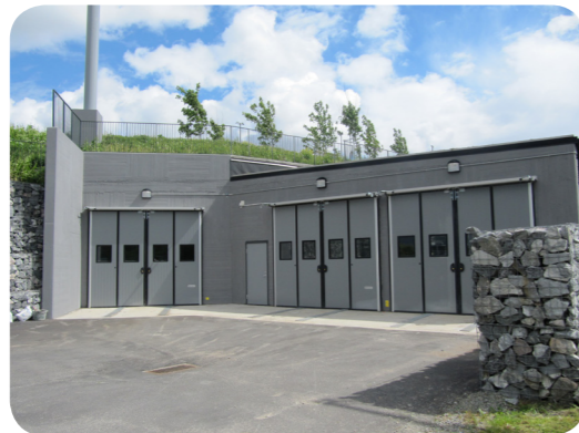
I utkanten av Annedal ligger terminalen, dit avfallet transporteras under mark.